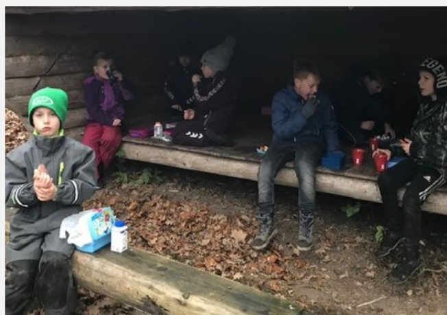
Shelterpladsen bliver flittigt brugt både sommer og vinter